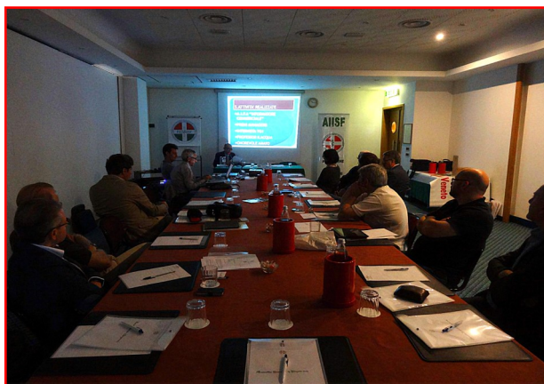
BOLOGNA: Esecutivo Nazionale 2015

E' stata convocata per il prossimo 27 maggio, alle ore 9:30, l' Assemblea Generale della Federazione congiunta all' Assemblea dei Presidenti delle sezioni AIISF presso i locali dell'Hotel Bologna Airport, Via Emilia, sito in via Marco Emilio Lepido, 203/14 - 40132 Bologna (tel. 051 40956 Fax. 051 405969).