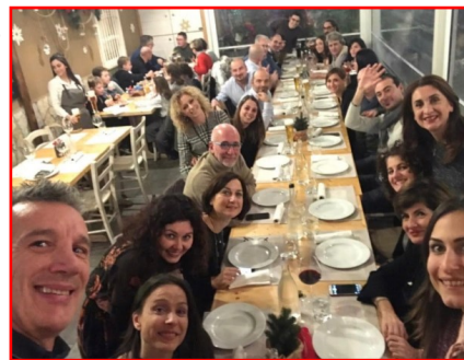
Cena degli Auguri