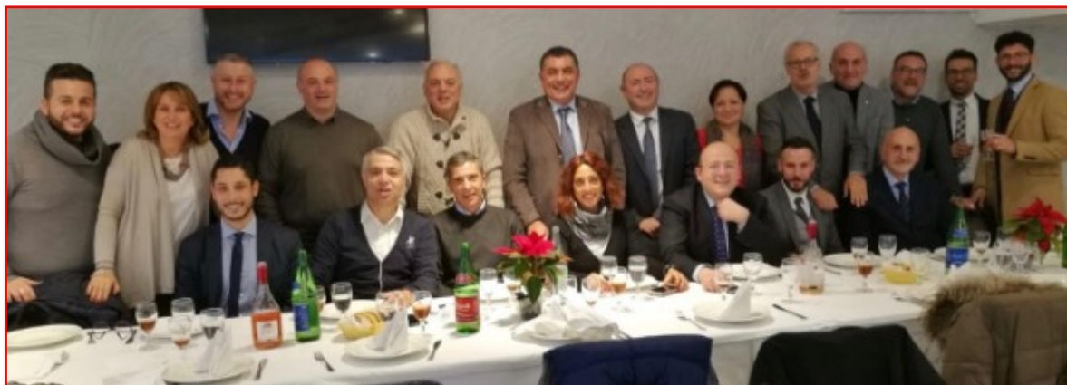
Cena degli Auguri